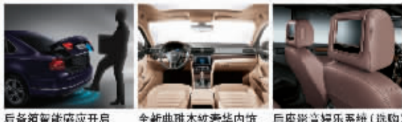
后备箱智能感应开启 全新典雅木纹奢华内饰 后座影音娱乐系统(选购)

真正的领袖，即使平凡举动，亦显卓然气度，只因其超然物外的非凡境界。2014款帕萨特，领先搭载后备箱智能感应开启及全方位智能升级版PLA自动泊车辅助系统，从容释放双手，智享创新科技带来的人性体验；更配备后排领袖尊享系统，缔造静谧私人天地，彰显尊崇地位，领略超然之境。