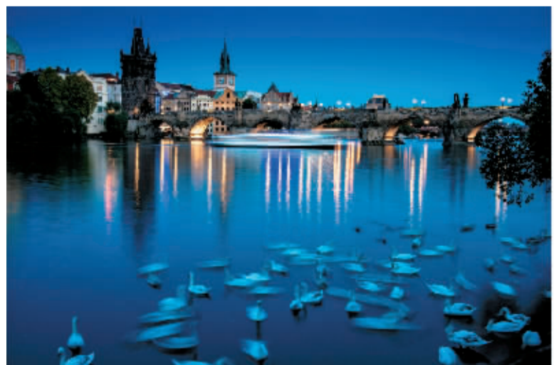
布拉格夜色