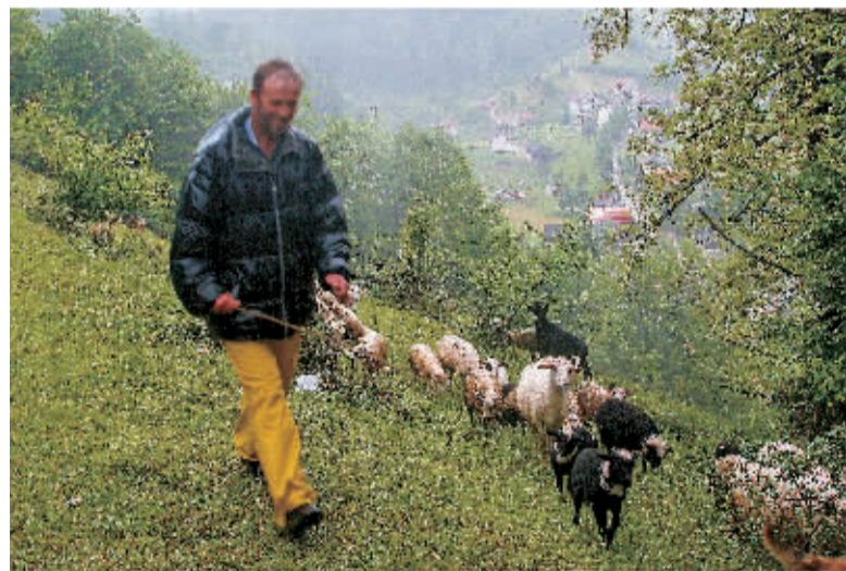
雨中放牧