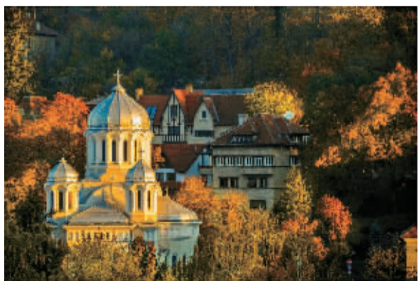
布拉索夫