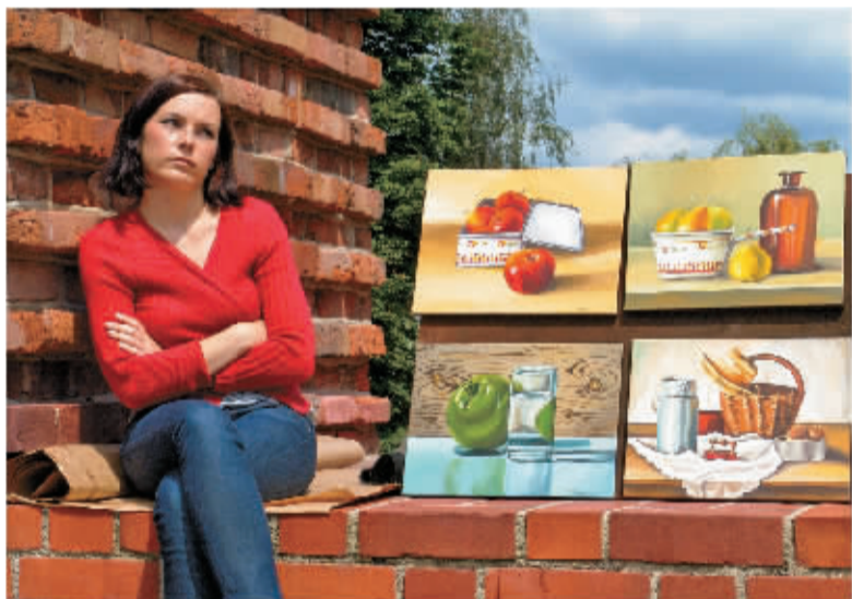
卖画姑娘

6月8日，“两会两展”期间，将在国际会展中心举办“宁波人看中东欧”摄影展。 彭莹 戴远阳 方平原 整理