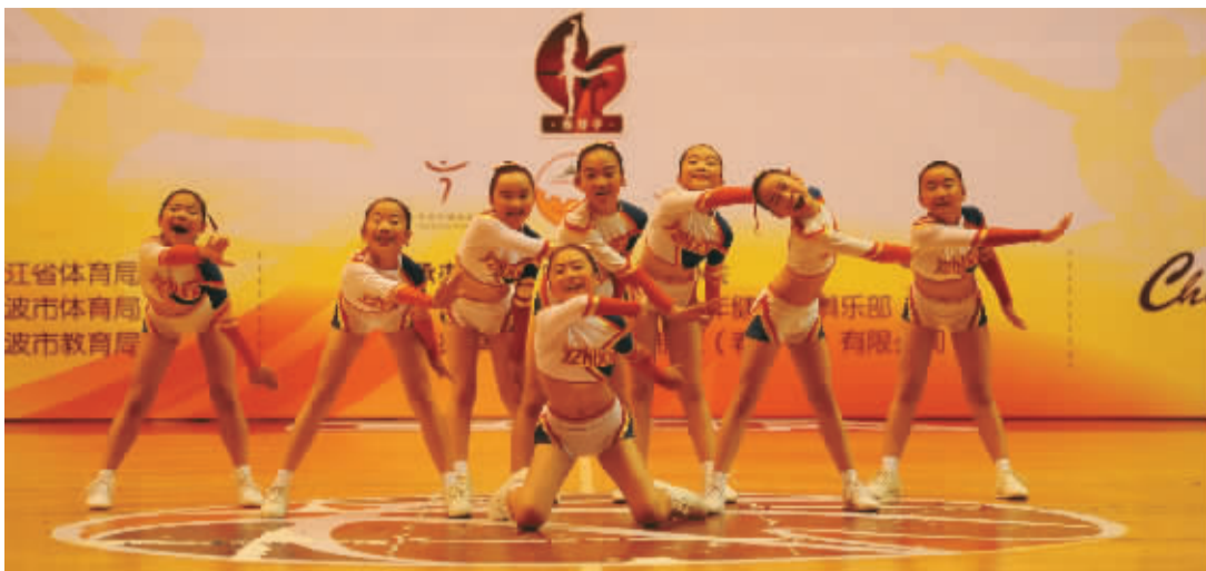
健美操比赛场景。