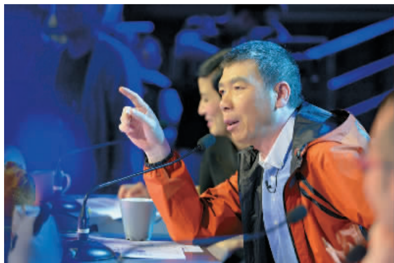
□记者 张磊杰 文/摄