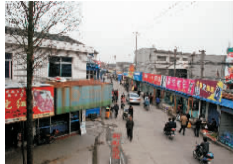
湾头区块改造前后