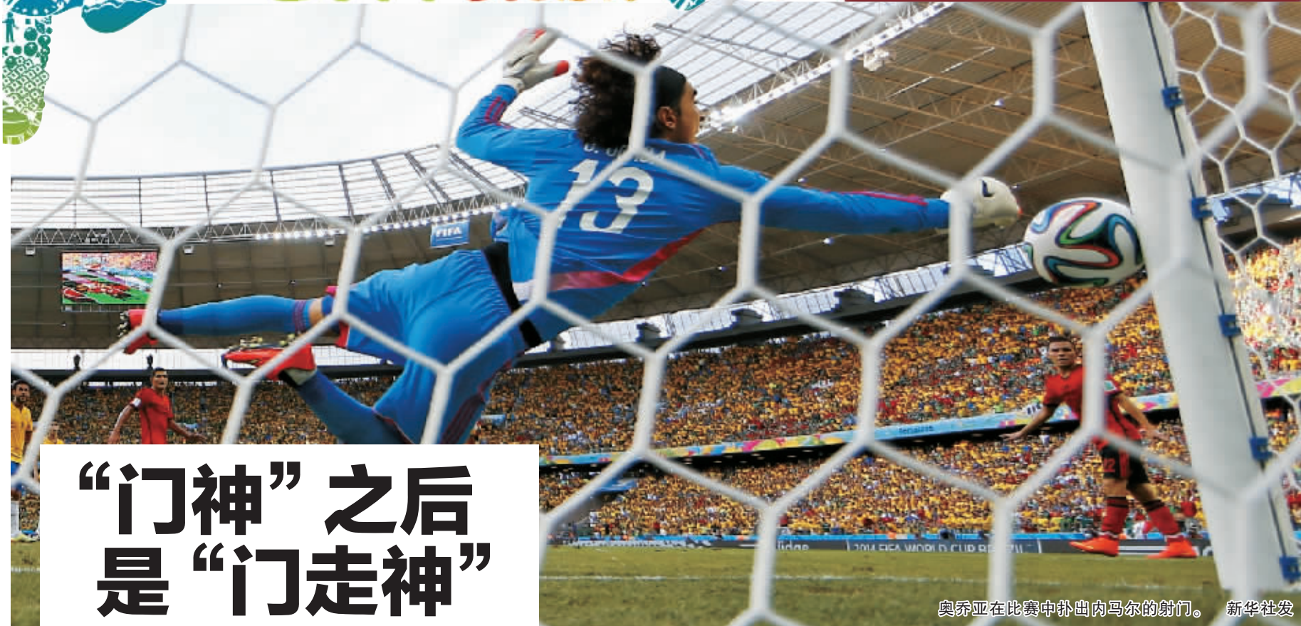
奥乔亚在比赛中扑出内马尔的射门。