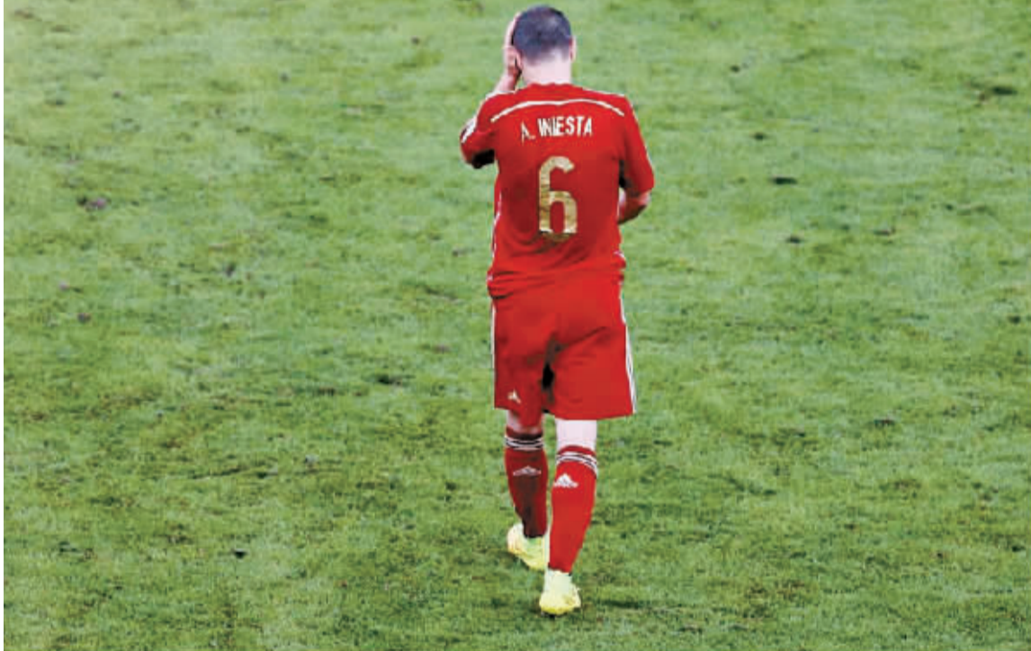
昨日，伊涅斯塔在比赛中落寞地走在球场上。