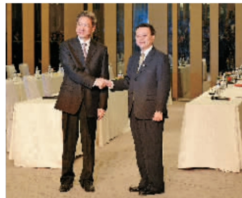
国台办主任张志军（左）与台湾方面陆委会主委王郁琦举行第二次正式会面。

据新华社电 国台办主任张志军25日上午搭乘中国国际航空公司CA185航班抵达台北桃园机场，展开为期4天3夜的首度访台行程。