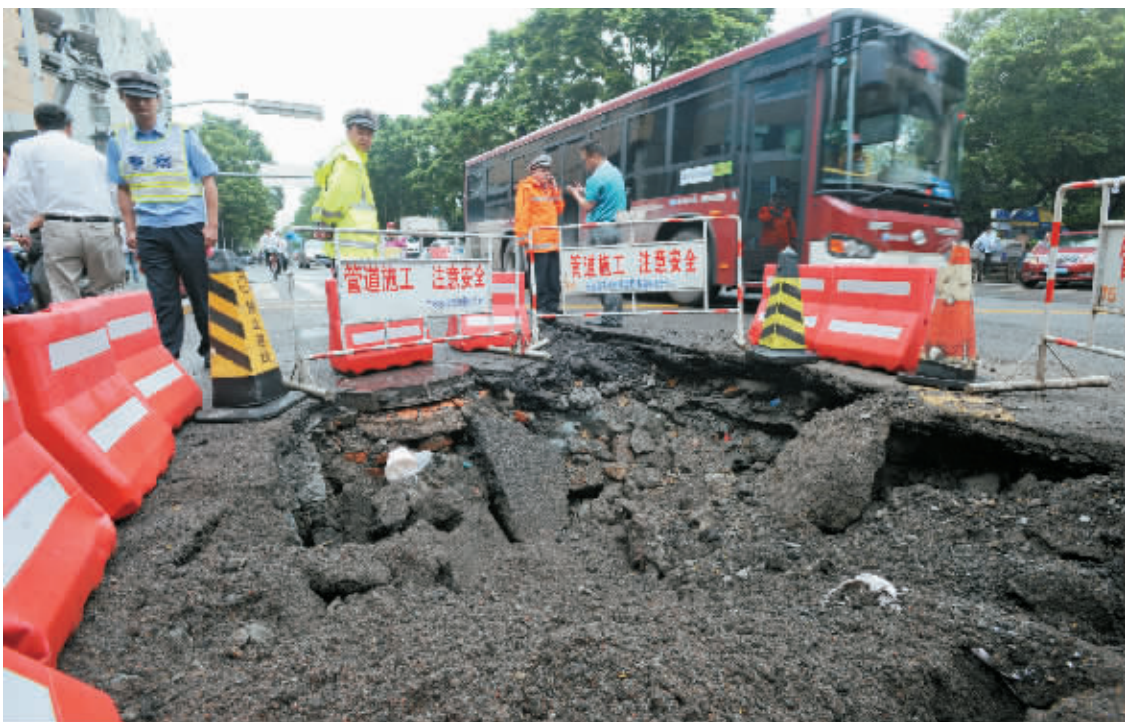
昨天上午,塌陷的路面已被围了起来。

居民们分析,水管爆裂、路面塌陷与大型工程车的碾压有关。那位向本报反映情况的余先生告诉记者,近半个月来,每晚六七点钟,就有很多大型工程车通行在镇明路上。因为车辆通行时震动很大,出于安全考虑,他和小区居民不止一次报警过。