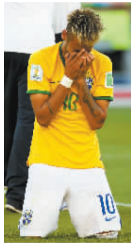
内马尔赛后跪地痛哭