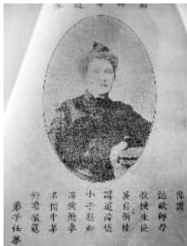
兰雅谷医生的夫人。