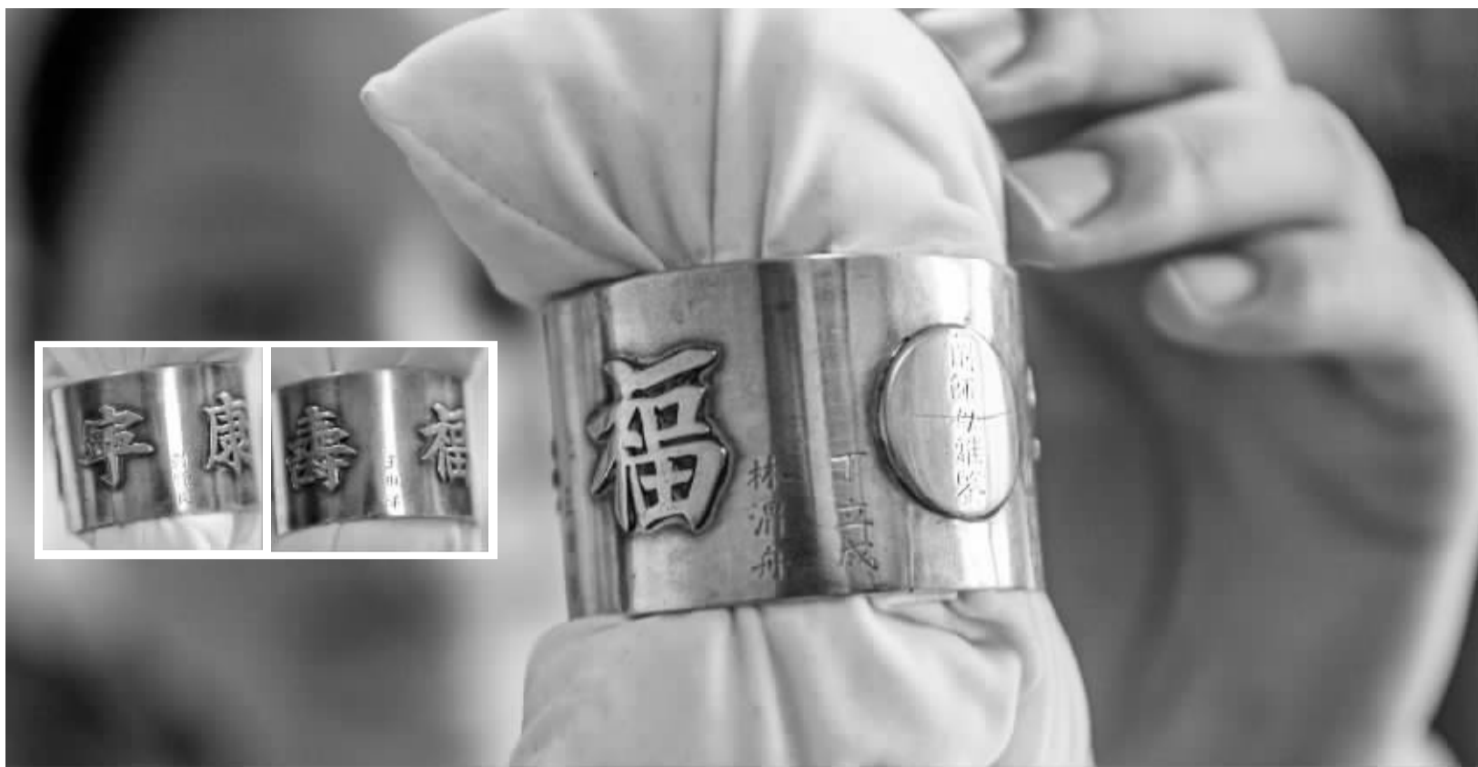
餐巾环上面镶嵌着“福寿康宁”四个立体字。