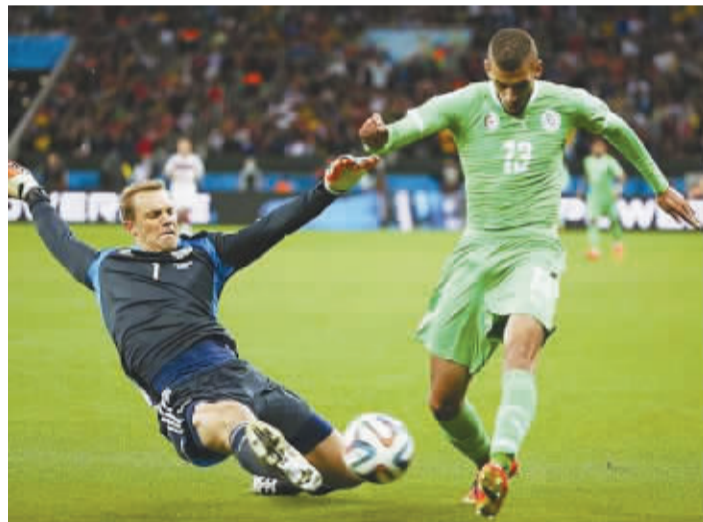
诺伊尔(左)在与阿尔及利亚队的比赛中做出专业放铲动作。

在马塞洛之后，一旦有男性球员在比赛中露出卖萌的表情或者可爱的举动，就会被冠以“XXX萌萌哒”的说法。