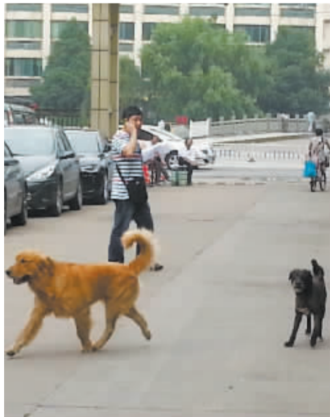
小区道路上狗乱窜。

针对此事,文化社区居委会的负责人告诉记者,他们统计了一下,小区里的狗一共有66只,有证照的才7只。他们此前一直在做居民的工作,但居民不听,他们也没办法。“我们上个月挨家挨户给居民发了文明养犬倡议书,还免费发放了防疫针。前段时间,我们还跟片区民警一起走访了好几户无证养狗的居民,告知他们再这样下去将依法采取措施。”