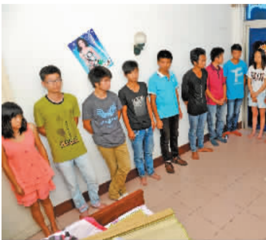
警方查处的一个传销窝点。