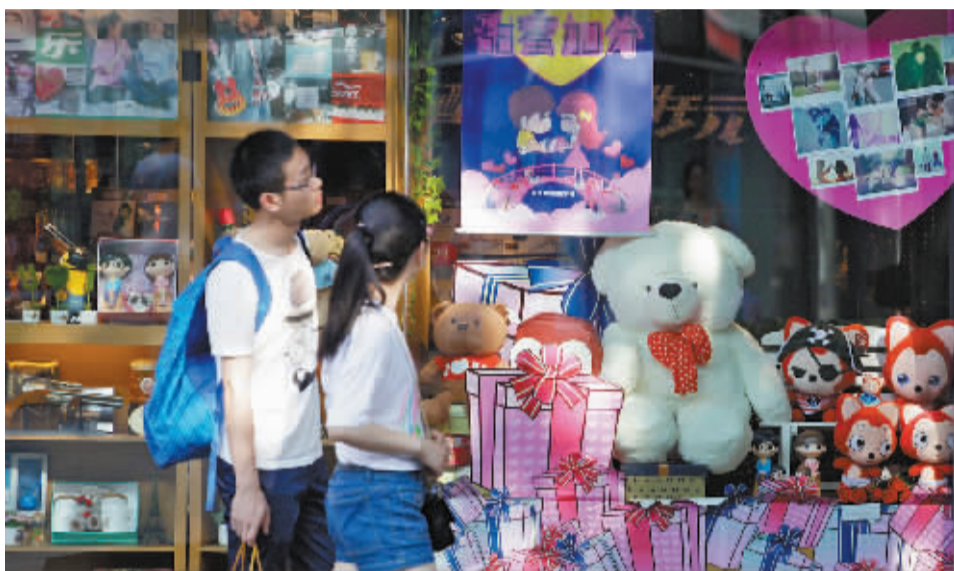
水晶街的一家商铺已经在开展以“七夕”为主题的促销。

“七夕巧克力和玫瑰花肯定是少不了的, 我刚从花店给女友预订了11朵玫瑰花, 就又赶过来给她买巧克力。”正在挑选巧克力的市民王先生告诉记者。采访中, 不少男士均表示, 鲜花和巧克力已经成为七夕节的固定礼物之一, 虽然年年都送, 但是一直都不落俗套。