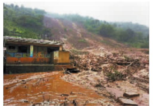
印度西部浦那市附近遭泥石流袭击的村庄(7月30日摄)。