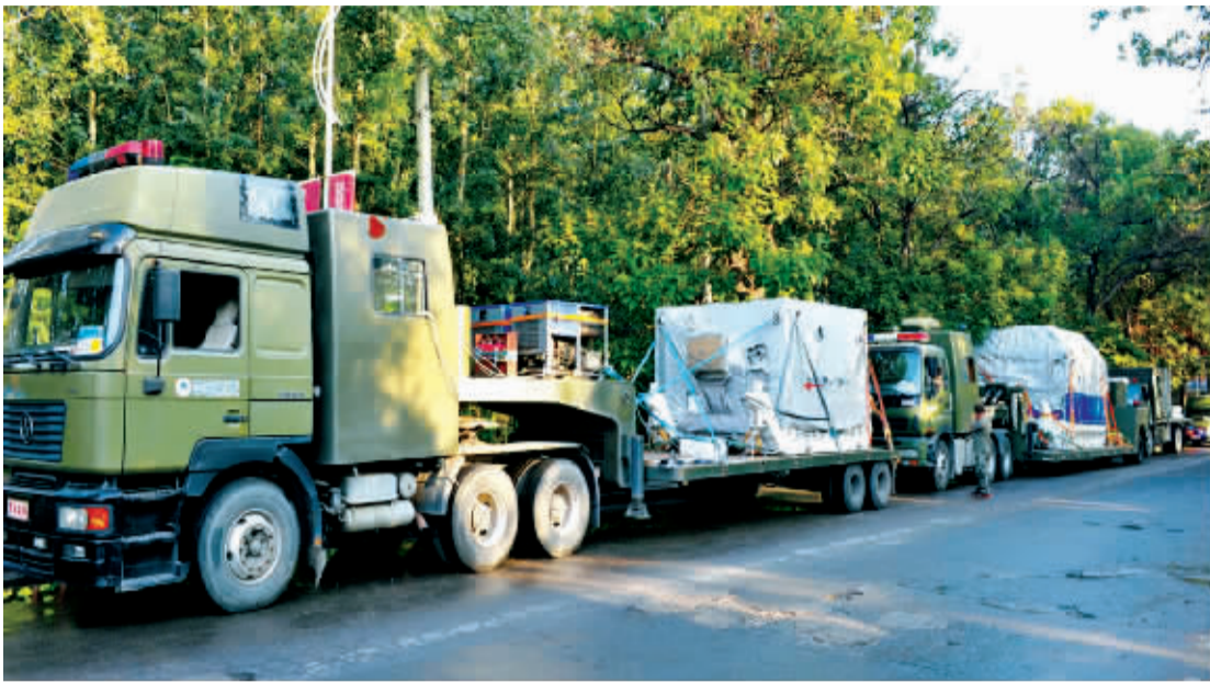
飞行试验器车队在运输途中。

记者从国防科工局获悉，执行探月工程三期再入返回飞行试验任务的飞行试验器10日从北京运抵西昌青山机场，随后转运至西昌卫星发射中心，逐步开展相关测试和试验。