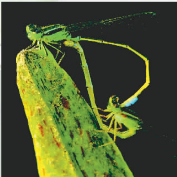
生命之歌 晚报拍客 常乐老兵 摄