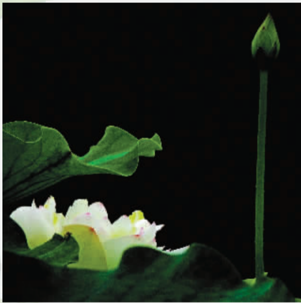
争奇斗艳