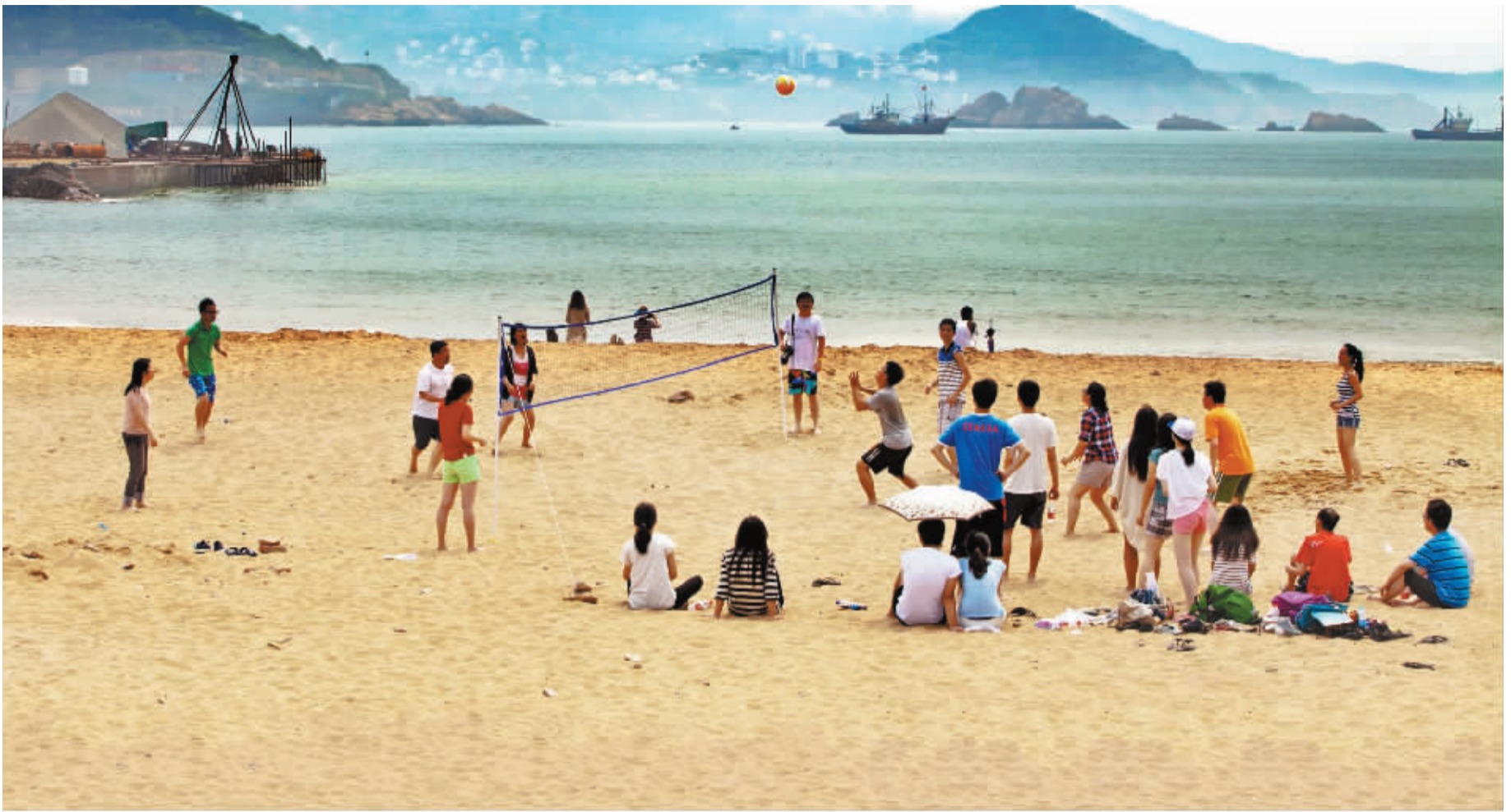
沙滩风情