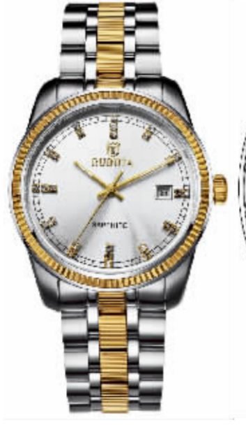
8012G 系列 专柜价 8600 元 钜惠价 2150 元 / 只