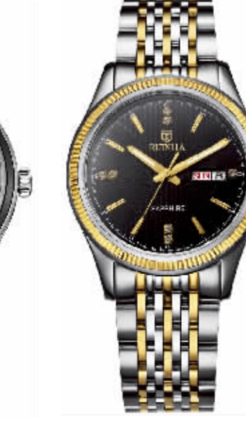
8056G 系列 专柜价 10800 元 钜惠价 2700 元 / 只