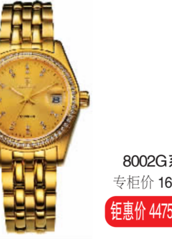
8002G 系列 专柜价 16990 元 钜惠价 4475 元 / 只