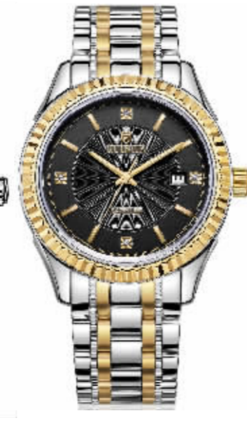
8037G 系列 专柜价 12990 元 钜惠价 3220 元 / 只