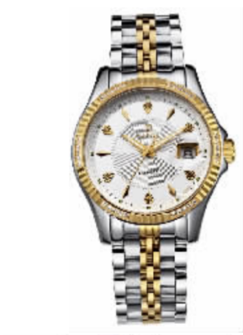
8008G 系列 专柜价 11800 元 钜惠价 2950 元 / 只

瑞尼达名表品牌保障售后服务中心： 宁波市江东区东胜路 10 号 天时世界名表中心 让您买得省心戴得放心