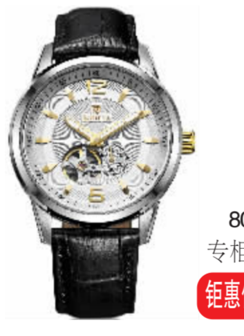
8071G 系列 专柜价 9500 元 钜惠价 2375 元 / 只