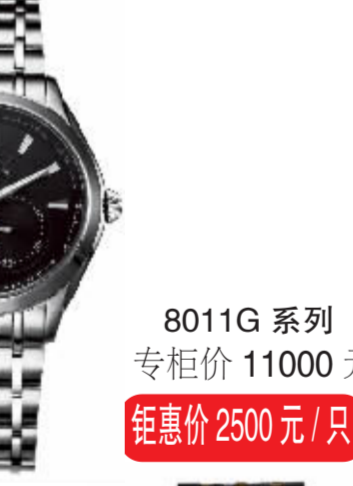
8011G 系列 专柜价 11000 元 钜惠价 2500 元 / 只