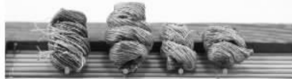
铁皮枫斗 铁皮枫斗 铁皮枫斗 水牛皮枫斗

辨别枫斗一般看四点： 看颜色、闻气味、掂重量、尝味道。只需掌握了这四个方面，基本您也是枫斗行家了。