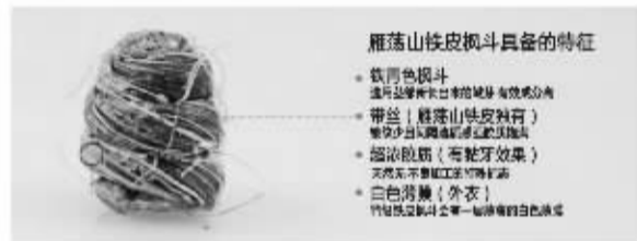
雁荡山铁皮枫斗具备的特征

“大家好，我是来自雁荡山的雁之斛金铁丝铁皮枫斗，我的颜色是铁青色，我有四个特征，大家请注意辨别，千万不要认错了！”