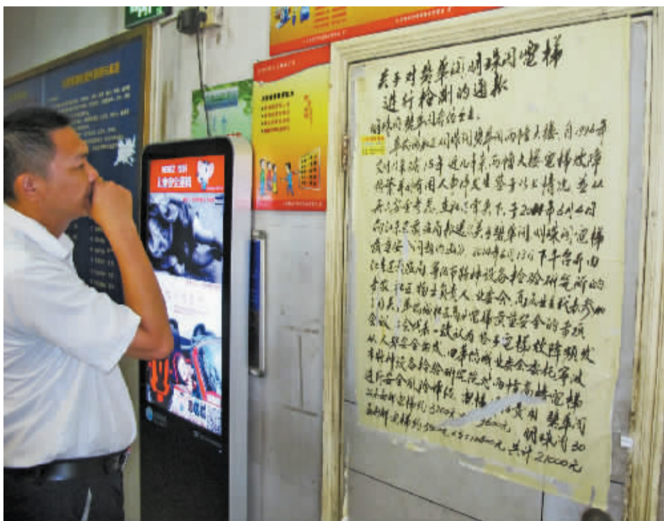
居民正在看电梯检测的通知。

“这些隐患很难消除,我们到时候也只能把电梯停用,否则发生什么事故谁也承担不了。”王主任说。