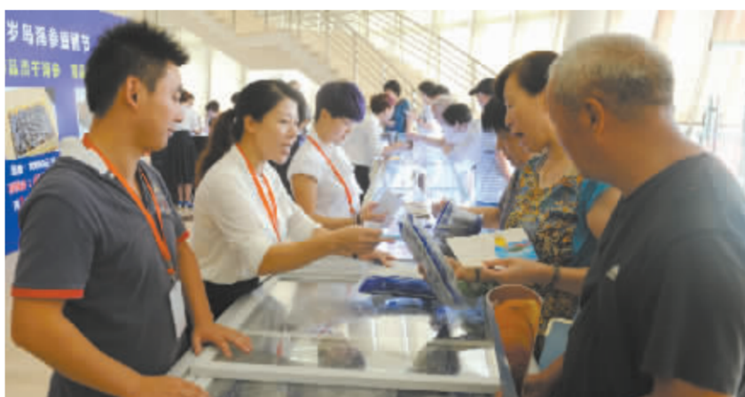
因回头客的强烈要求,“厂商直通车”延期惠民的大连海参非常热销。