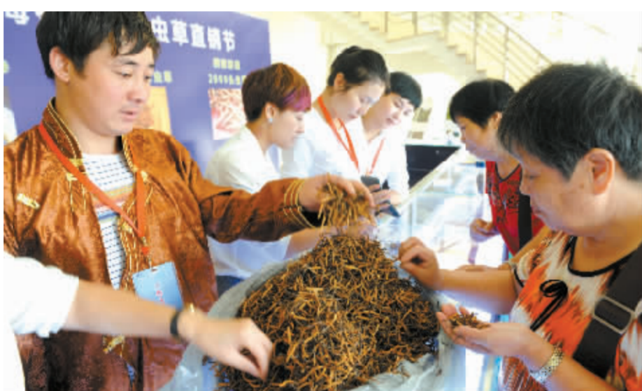
昨天,西藏那曲冬虫夏草直销节在宁波报业大厦2楼举行。来自那曲县达沙乡七村原产地的冬虫夏草受到市民的热捧。