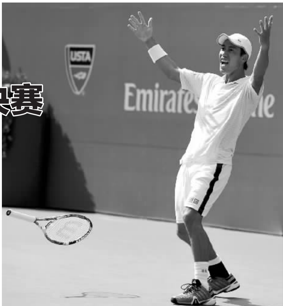
锦织圭在比赛后庆祝。

也许很多中国球迷此前对于锦织圭这个名字还不太熟悉,但是他曾经的女朋友在中国却有着极高的知名度——那个会说一口东北口音普通话的乒乓“瓷娃娃”福原爱。2008年,20岁的福原爱和18岁的锦织圭被媒体拍到街头约会,在日本国内引起轰动,尽管当时福原爱勇敢地选择了“不否认”,但一年多后,这对金童玉女终究还是在舆论和运动成绩等多重压力下分手。