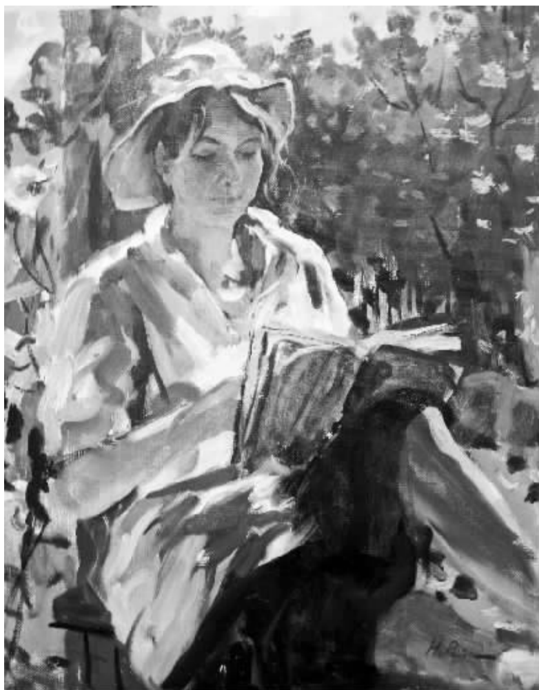
尼古拉·列宾的代表作之一《娜塔莎》。