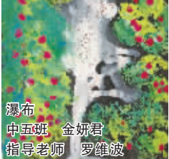
瀑布 中五班 金妍君 指导老师 罗维波