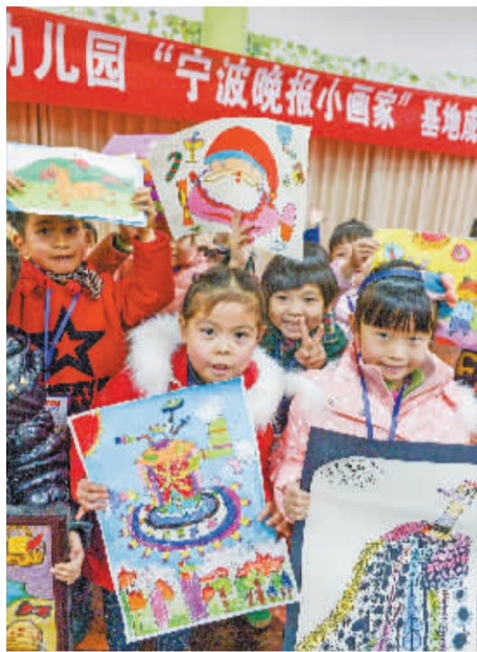
第三幼儿园小画家参加基地成立仪式。