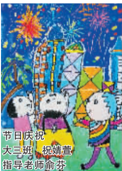
节日庆祝 大三班 祝婧萱 指导老师 俞芬