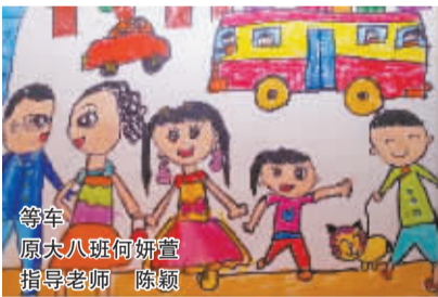
等车 原大八班何妍萱 指导老师 陈颖