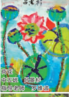
荷花 中五班 吕景杉 指导老师 罗维波