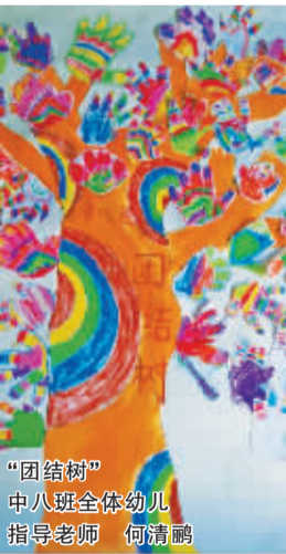
“团结树” 中八班全体幼儿 指导老师 何清鹏