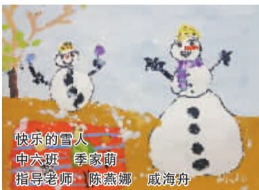
快乐的雪人 中六班 季家萌 指导老师 陈燕娜 威海舟