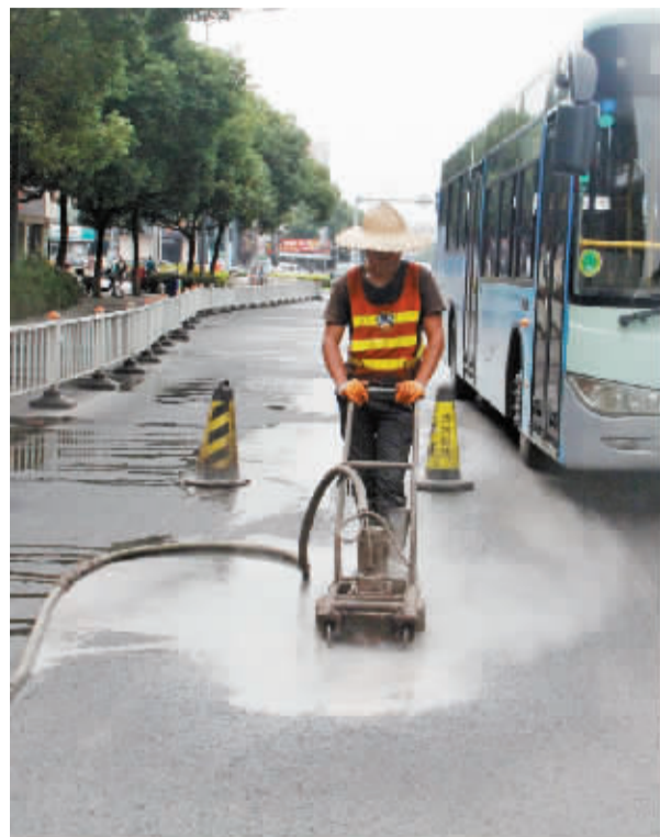
联丰路公交专用道开始划线

去掉原有交通标志线,划上新的公交专用道标志线。记者昨天从市治堵办获悉,今年核心区首条启动建设的公交专用道——联丰路—柳汀街(机场路至解放南路)公交专用道已进入交通设施建设,预计年内完工。