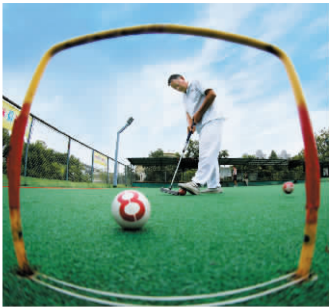
门球场上,老人在独自练习击球。