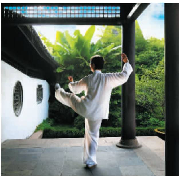
公园里,市民在专心致志地练拳。