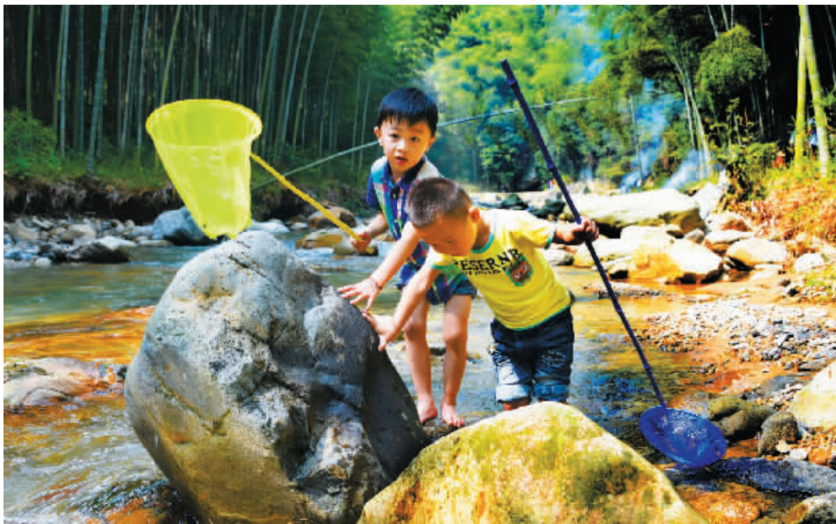
上周末,余姚大隐镇的四明山溪流中,两个男孩拿着网兜嬉水,玩得不亦乐乎。