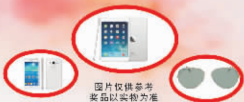
图片仅供参考 奖品以实物为准

专业 舒适 时尚 平价 配镜价格仅为市场价的1/4-1/2 扫微信加关注 赠送饮料一瓶