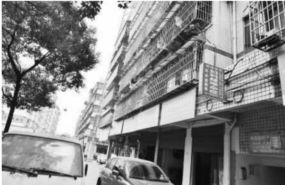
郭宜品在长沙租住的居民楼

失联60多天的洛阳副市长郭宜品,10月6日在长沙马王堆一出租房内被抓。目前,他已被移送回河南。他为什么会出现在长沙?藏身长沙的这两个月他是如何生活的?记者再次回到现场,探访了出租房房东、邻居和周边商户,从他们的回忆中,我们试图还原郭宜品与外界“失联”这些日子的生活。