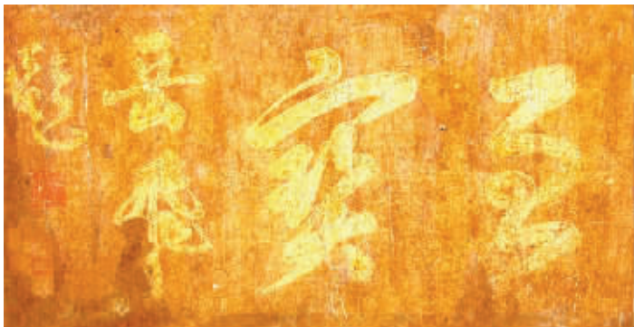
岳飞为裘氏家谱题“至宝”