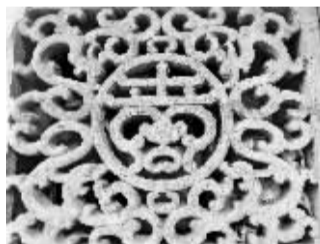
广仁街清代建筑四龙护春窗花