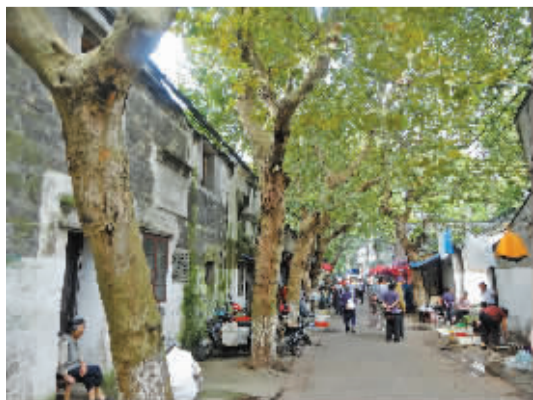
梧桐成荫生活气息浓厚的广仁街