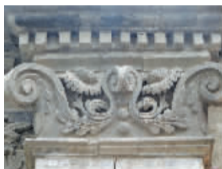
横河街民国建筑上的精美图案

海曙区秀水历史街区,是宁波老城内存最为完好的历史街区之一,如婉约的江南女子忠实地记录着古城的千年变迁,承载着许多宁波人的共同记忆和无限情感。在不同年代古建筑相继消逝的情况下,这里仍如博物院一般成片留存着这个千年古城的“民居群落基因”。目前,秀水历史文化街区保护规划已经出台,并向市民征求意见。