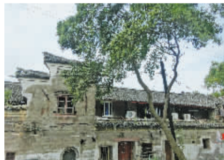
大桥街上的清代建筑徐宅

清代初期,经过战乱后的大规模建设,宁波城街巷格局已经定型,大街27条,巷150条,格