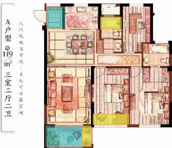
色块区域为可扩展空间，共8.8㎡(阳台计算一半面积)