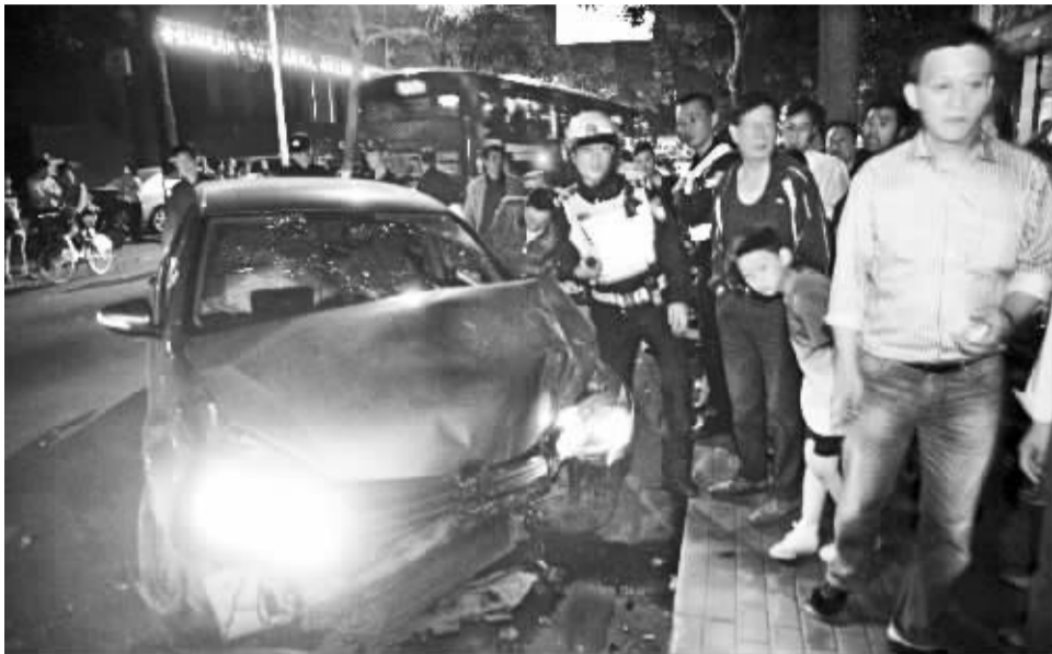
肇事轿车。