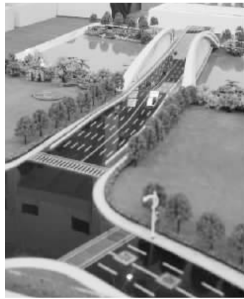
图为展出的澄浪桥模型,该桥计划于明年底建成。

本报讯(记者 张璟璟) 由市住建委主办的“活力都市·宜居宁波——2014年宁波市城市建设主题展”,昨天起在会展中心1号馆展出。记者从现场获悉,跨甬江的中兴大桥和院士桥均计划于明年开建,2018年建成;而跨奉化江的澄浪桥及接线工程,自今年1月正式动工以来进展顺利,计划于明年底完工。