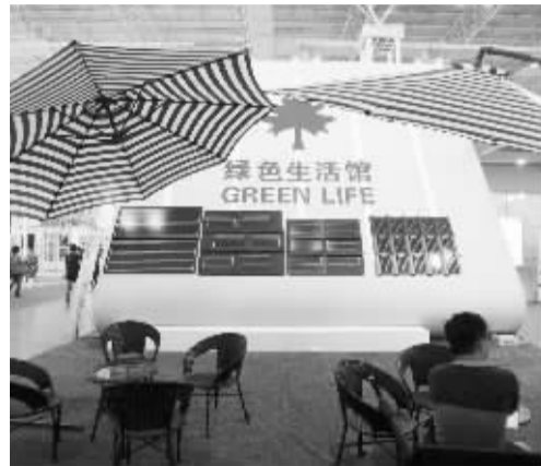
住博会上展示的太阳能光伏瓦片。

中国指数研究院的报告称,展望未来,随着与房地产相关的各项政策落地实施,各类需求释放或将促进市场回暖,但在高库存以及全年销售业绩压力等因素影响下,四季度房企仍将会以去库存为主,价格降幅或将逐步收窄。