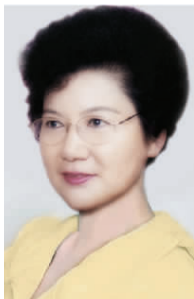
马肖琳美丽工作室