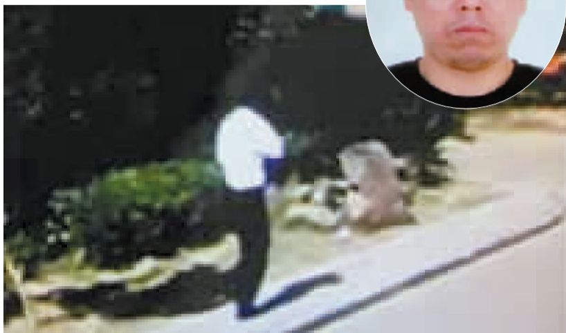
犯罪嫌疑人在监控中留下的影像。