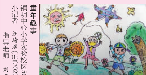
童年趣事 镇明中心小学实验校区504班 小记者 汪琦溪(证号02203) 指导老师 刘正南