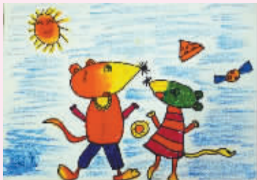
鼠小弟 常青藤幼儿园大三班 虞佳馨