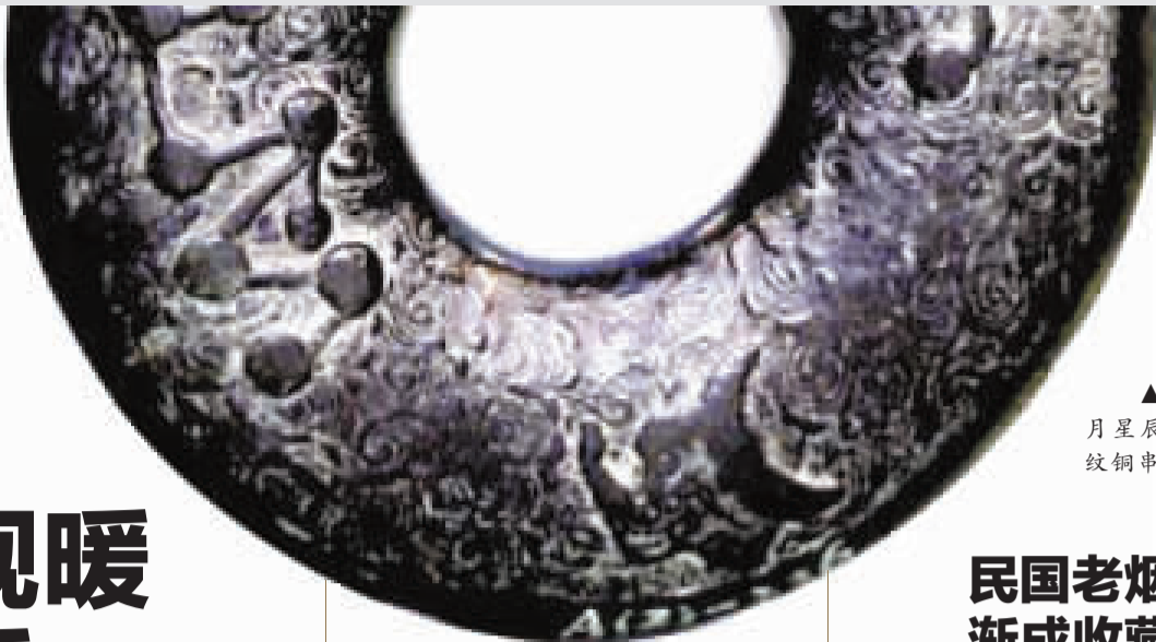
▲宋日月星辰八卦纹铜串铃