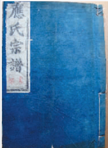
思绥草堂藏咸丰《显爵应氏宗谱》书影。

咸丰年间的应氏宗谱与南宋历史人物应衢相距六百年,两者有何关系呢?其实,《显爵应氏宗谱》虽然纂修于清代,但是从历史渊源上来讲,它与应衢却有着很大关系。这是因为应衢作为浙东应氏著名人物,曾编修过四明地区有明确历史记载的第一部应氏宗谱——《显爵渊源世系录》。可惜这部宗谱现已无存,然而中国封建社会的每一次修谱活动,几乎都有搜集汇编前几次家谱序言等文献的传统,令人欣喜的是咸丰《显爵应氏宗谱》正好收录了这方面的宝贵资料,成为今人了解应衢编修应氏宗谱最直接、最可靠的史料。