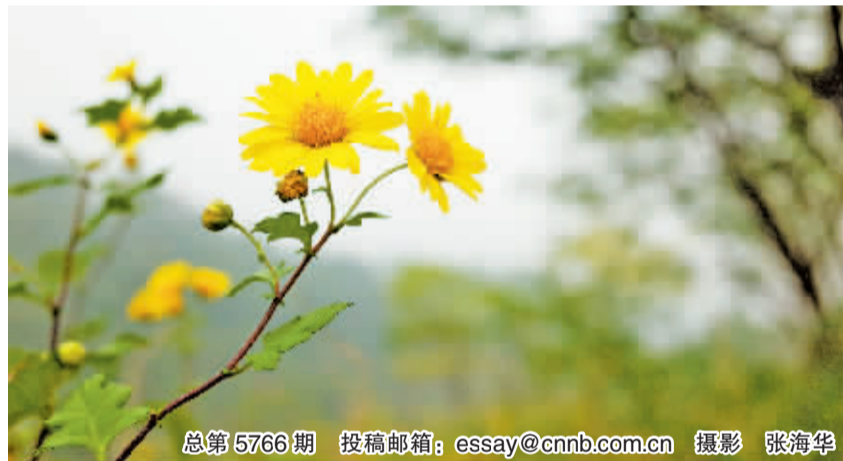
总第5766期 投稿邮箱: essay@cnnb.com.cn