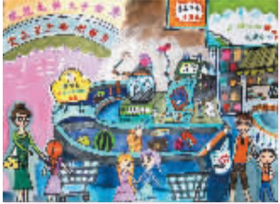
未来超市 艺术实验学校202班 小记者 陈果(证号1502577)