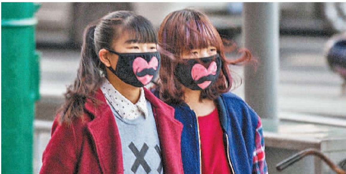
昨天,在江夏公园旁,两位女孩戴着爱心口罩出行。

同样是这股强劲的西北风,前天下午冷空气带来了北方的输入性污染源,使得甬城空气质量明显下降,大部分地区出现重度污染,而深夜大气经历了大风的洗礼,霾迅速散去。前天半夜市区空气质量又恢复到良好的水平。不过昨天凌晨5时前后的两三小时,市区空气质量又出现了反复。朱龙彪表示,这是因为大风自北方南下,当时正巧又带来了一波输入性污染源。好在风力强劲,清晨的重度污染于昨天中午前后明显好转,并且良好的空气质量会一直延续到今天。