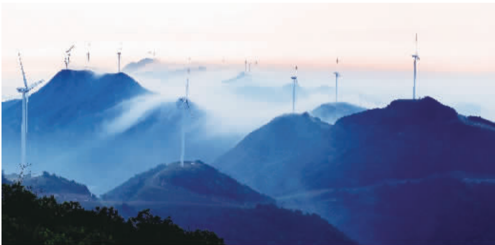
穿山半岛风电新能源