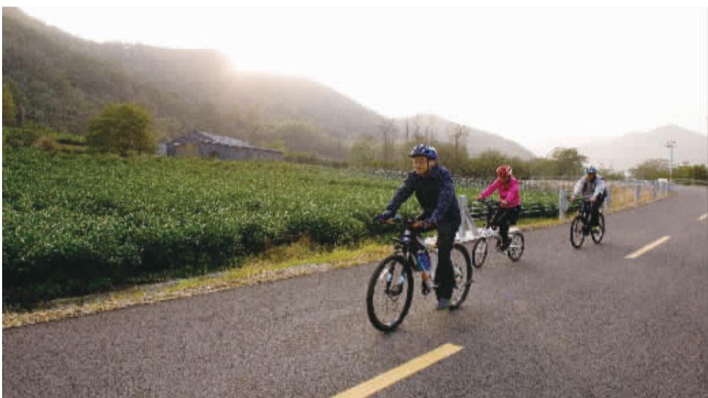
骑行在秀美山川公路上

而文化设施方面,除了群众基础文化设施建设外,北仑区还重点投资建设中国港口博物馆,今年11月北仑港口文化节期间,该馆正式对外开放。这个现代化博物馆,集展示、收藏、教育、科技、旅游、学术研究于一体,有助于进一步弘扬和提示港口文化,更好地保护水下文化遗产,揭开北仑科学发展的新标志,还为全面建成现代化国际港口城市提供重要的文化平台和对外交流平台。