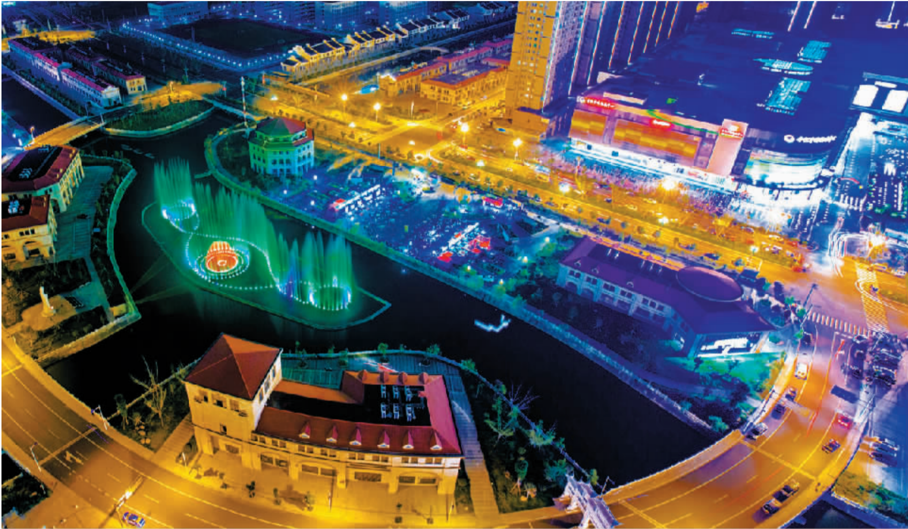
商务新城区夜色璀璨