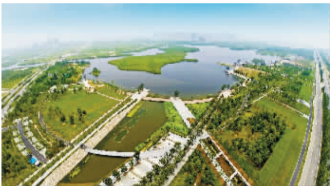
17.56平方公里的观塘湖区正在创建国家级低碳示范城区