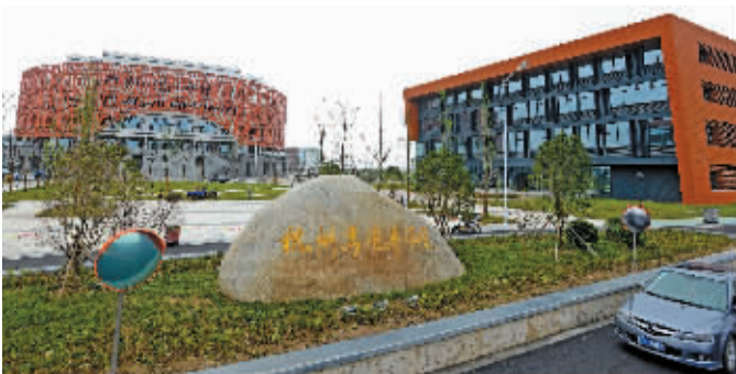
杭州湾汽车学院为省内首家培养汽车通用人才的本科院校