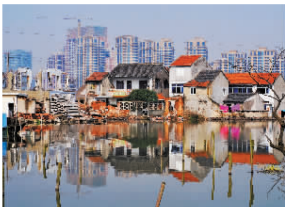
高新区CBD原址 胡小波摄于2009年3月