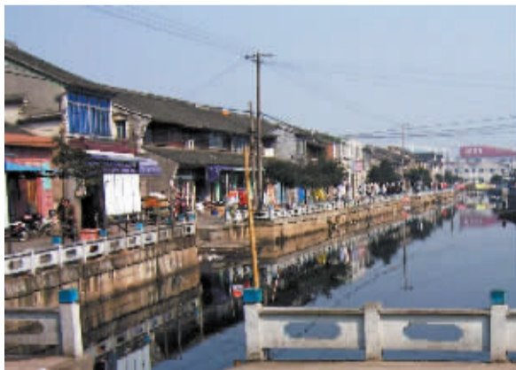
原姜院村全貌 邱亚平摄于2004年