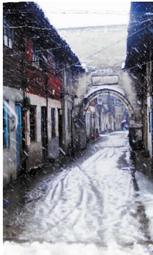
梅墟社区旧居