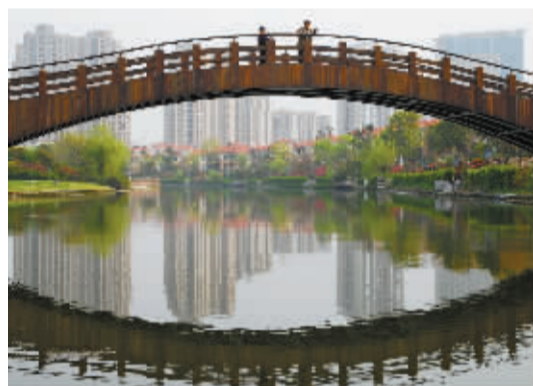
科技公园与周边生活区相映成趣 胡小波摄于2011年4月