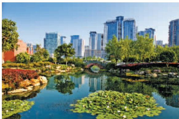
大东江碧波荷香 丁红摄于2011年5月