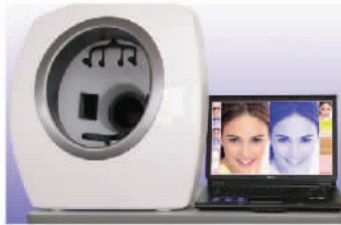
▲高科技短肽透皮祛斑仪

短肽透皮祛斑价格低，另一方面也由于其操作简单。和相较于激光祛斑，这种不破皮、不伤肤的祛斑方法，就像美容院给客人洗脸一样简单，一涂抹，二导入，三清洗，一次做下来，一分钟就可以了，完全不影响工作和生活。