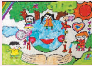
保护地球 江北槐树幼儿园 大二班 董楚煜

这次我为同学们表演《逗你玩》,我自己扮演三个角色。我先说旁白:“有一天,妈妈在屋里干活,小宝在外面玩,妈妈要小宝看好晾晒的衣服。”这时来了一个狡猾的小偷。我跳到一边扮起小偷来,把背一拱,抬起头,睁大眼睛,双手往身后交叉一放,奸笑着问道:“小朋友,你叫什么名字啊?”我又跳到一边扮起小宝卖起萌来,奶声奶气地说:“我叫小宝!”然后我继续跳到小偷那边,嘴角向上一斜,说道:“你认识我吗?”“不认识。”小偷坏笑道:“我姓逗,叫逗你玩,你叫我呀!”小宝天真地学说:“逗你玩!”小偷高兴地说:“好极了!”接着我把手往上一伸,做出偷衣服的样子。我的一番说