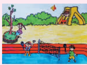
快乐的假日 新芝小学502班小记者 陈羽馨(证号1509997)