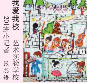
我爱我校 2011班小记者 张芯语 艺术实验学校