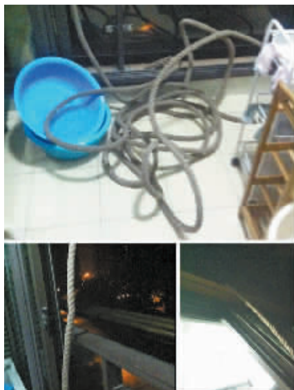
住户发现的绳子。

采访中,记者了解到,鄞州古林的水岸枫情小区曾经也面临过能不能装室外晾衣架的问题。小区业委会成立后,征询了全体业主意见,结果显示超过三分之二的业主同意安装。要安装晾衣架的业主需要签订一份承诺书,根据要求,要统一样式、规格、颜色以及安装位置,晾衣时要甩干,不晒滴水物。如果因为晾晒衣物过重引起安全隐患,责任由本人承担。枫园社区居委会负责人金先生告诉记者,房产商对开发的楼盘外观比较重视,因为展示的是企业品牌,但他认为,业主们的晾衣需求同样要重视,交由业主集体表决是个蛮好的形式。